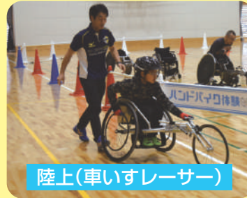
陸上(車いすレーサー)