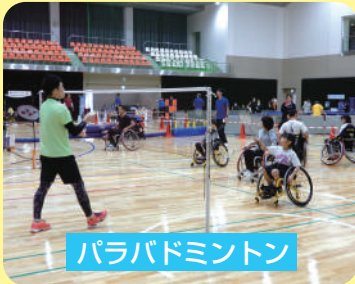
パラバドミントン