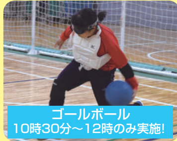
ゴールボール 10時30分~12時のみ実施!