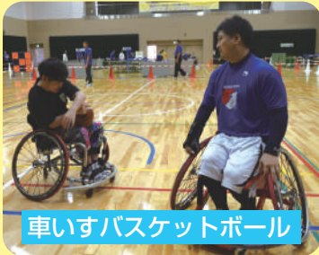
車いすバスケットボール