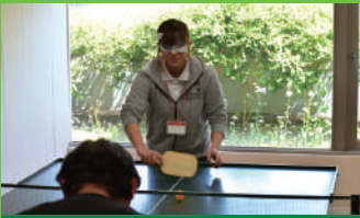
サウンドテーブルテニス 12/11 13:30~15:30 12/12 10:30~12:30