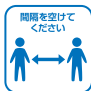
間隔を空けてください