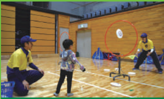
フライングディスク 12/11 13:30~15:30 12/12 10:30~12:30