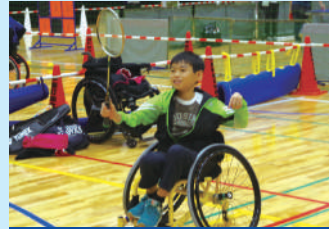
パラバドミントン