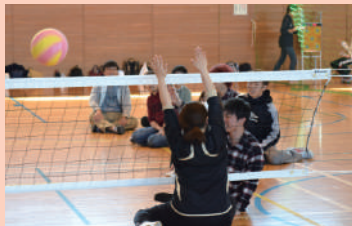
シッティングバレーボール 10:30~12:30