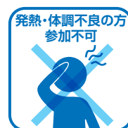
発熱・体調不良の方参加不可