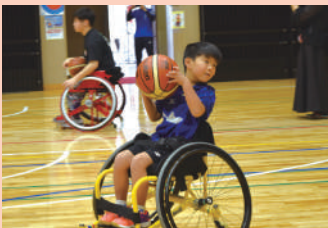
車いすバスケットボール 13:30~15:30